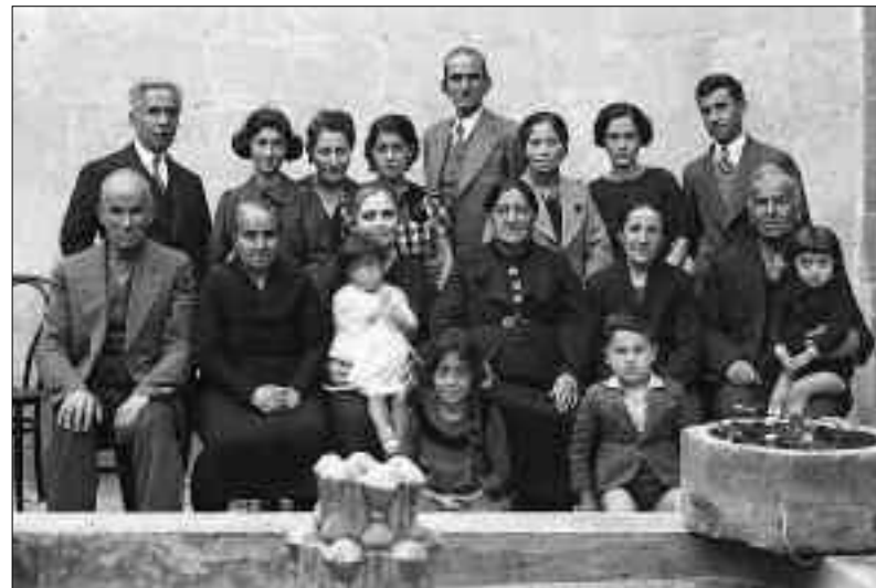
Ընտանեկան նկար Սալիպէի տան բակին մէջ, Հալէպ 1938