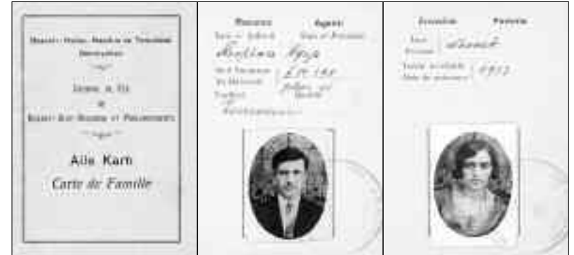
Երկաթուղագծայիններու ընտանեկան տեսրակ