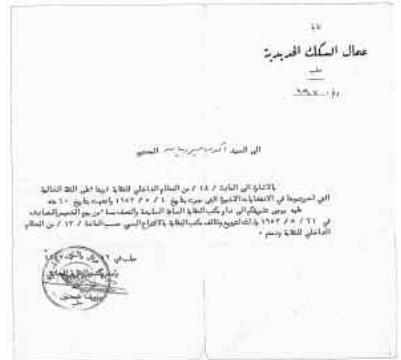
Հայէպ, երկաթուղագծայիններու վարչութեան անդամաթուղթ, 1953